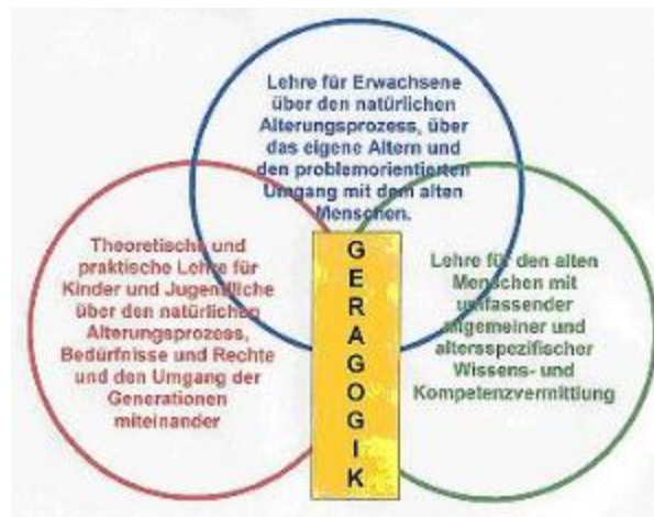
Abb. 2: Darstellung der 3 Hauptbereiche der Geragogik. Lehre für Erwachsene, Theoretische und praktische Lehre für Kinder und Jugendliche, Lehre für den alten Menschen.